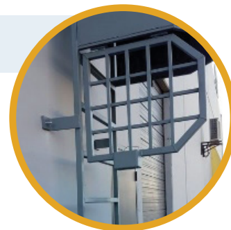
Échelle verrouillable 4