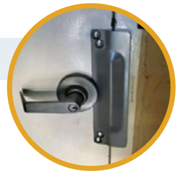
Dispositif de protection de verrou/plaque antivol 3